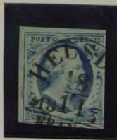
1853 PLAAT II LICHT STAALBLAUW