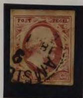
1853 PLAAT II