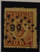
T 13 1/4 II