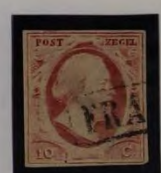
PLAAT X 11 1862 DUN PAPIER