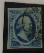
11 D. BLAUW