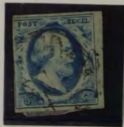
1854 PLAAT III