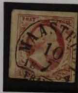
PLAAT II MAASTRICHT 10/7 1854