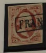
1857 PLAAT V 2H D. ROOD