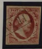
1861 PLAAT VII