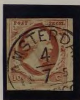
1857 PLAAT V DOFROOD