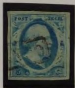
1861-1862 PLAAT V