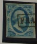
1858 PLAAT IV