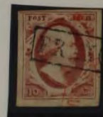
1862 PLAAT 10