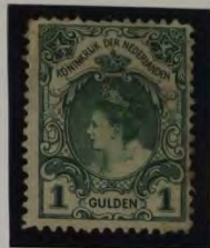
AFWYKENDE KLEUR OP DUN PAPIER