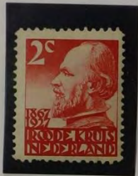
KON. WILL III