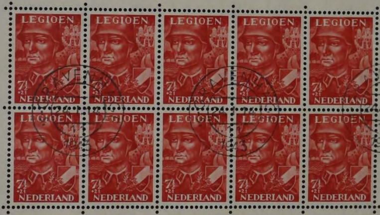
ZEGEL, UITGEGEVEN TEN BATE VAN HET VOORZIENINGSFONDS VAN HET NEDERLANDSCH LEGIOEN, 1942.