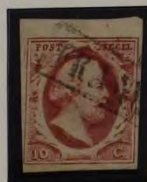
1857 PLAAT V STEMPEL FRANCO KASJE