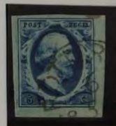
1853 PLAAT II D. BLAUW