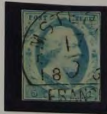
1858 PLAAT IV MELKBLAUW