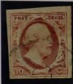
PLAAT IV 1 1856