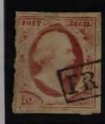
PLAAT IX 11 1862 DIK PAPIER