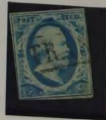
1863 PLAAT VI DUN PAPIER