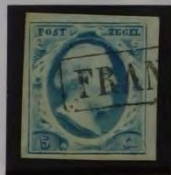
1854 PLAAT III 1k. LICHTBLAUW