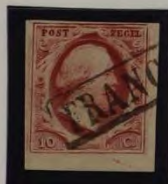
1862 PLAAT VIII