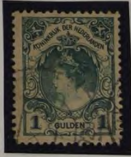
DONKERE KLEUR DUKKE LETTERS