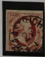
PLAAT V MAASTRICHT