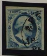
1853 PLAAT II WIT PAPIER