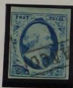
1863 PLAAT VI PORIEUS PAPIER