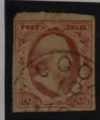
PLAAT IV 1856-1857