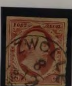
PLAAT IV ZWOLLE 8/12