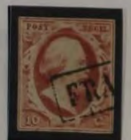
PLAAT VII 6 1861