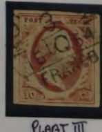
PLAAT III 1864