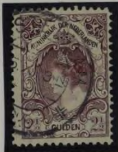
GULDEN VET ANDERE KLEUR LYNTANDING 11 1/2: 11