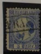
N T. I