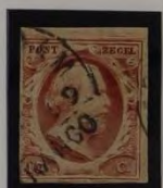
PLAAT VI 6 1860