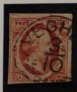
1856 PLAAT IV