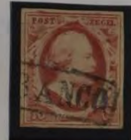
PLAAT IX 1 1862