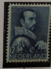
J.P. SWEELINCK 1562-1621