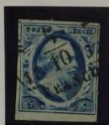
1852 PLAAT I 1B D. BLAUW 1D