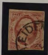
1853 PLAAT II