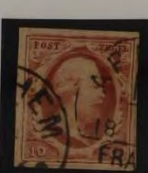
PLAAT V 21 ROOD LICHT GEVLEKT