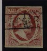
PLAAT VIII 7 1862