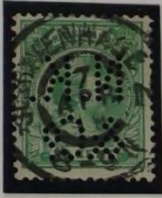
N.K. & Co