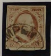
1853 PLAAT II