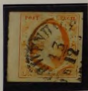
1852 PLAAT I GEELORANJE (RANDSTUK)