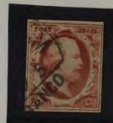
1857 PLAAT V