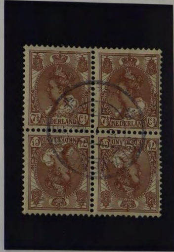
STEMPEL 'S GRAVENHAGE 1925

KEERDRUK TÊTE BÊCHE GEDRUKT VOOR POSTZEGELBOEKJES