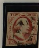
1853 PLAAT II Foudje & Streepje Mous