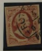
1863 PLAAT VI