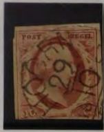
PLAAT II HOOORN 24/10 1853