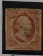
PLAAT IX FRANCO