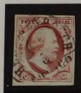
'S HERTOGENBOSCH STEMPEL 1A PLAAT 1A