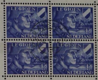
ZEGEL, UITGEGEVEN TEN BATE VAN HET VOORZIENINGSFONDS VAN HET NEDERLANDSCH LEGIOEN, 1942.