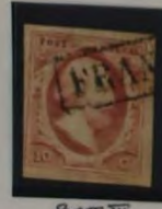
PLAAT IX 1862