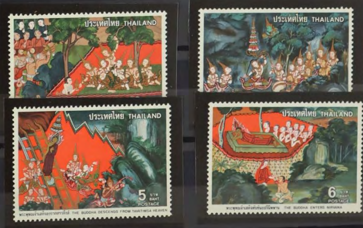
WAND SCHILDERINGEN w.3 1978 T.13/4