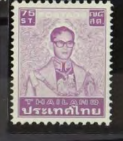
KONING RAMA VII