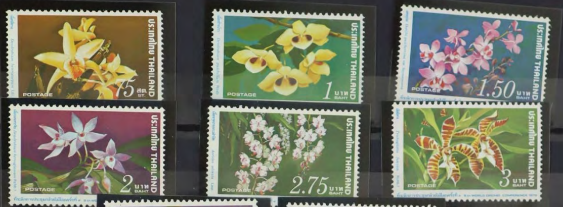
ORCHIDEE Conferentie w.6 1978 T.11:13