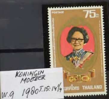
KONINGIN MOEJER w.g 1980 T. 15: 14/4