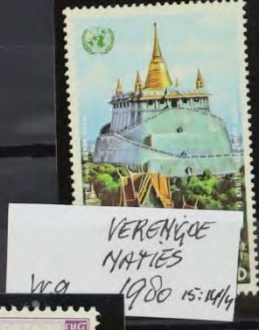
VERENGE MAYIES w.g 1980 15: 14/4