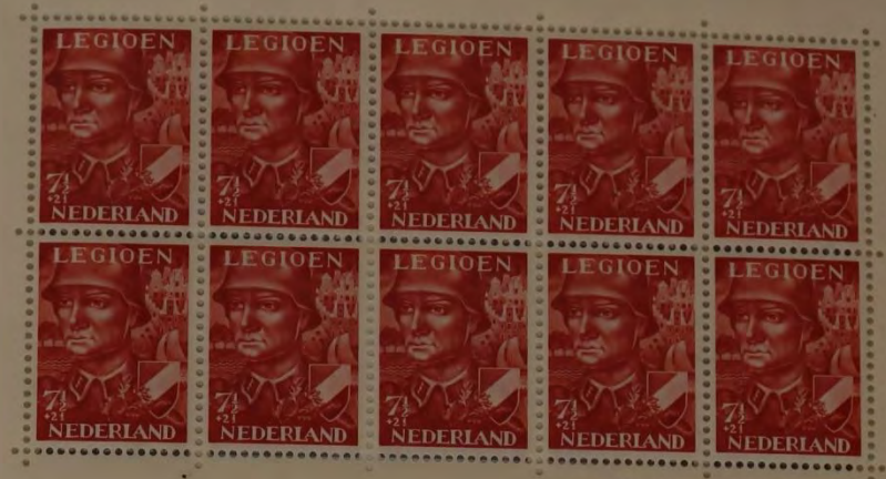
ZEGEL, UITGEGEVEN TEN BATE VAN HET VOORZIENINGSFONDS VAN HET NEDERLANDSCH LEGIOEN, 1942.