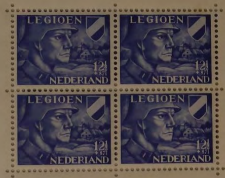
ZEGEL, UITGEGEVEN TEN BATE VAN HET VOORZIENINGSFONDS VAN HET NEDERLANDSCH LEGIOEN, 1942.