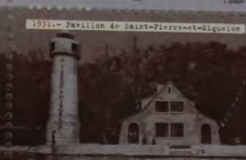
1931 - Pavillon de Saint-Pierre-et-Miquelon 3,00 Saint-Pierre-et-Miquelon-RF