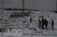
1923 - À pied sur la glace 3,00 Saint-Pierre-et-Miquelon-RF