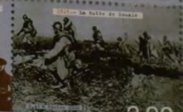
1923 - La battée de Souda 3,00 Saint-Pierre-et-Miquelon-RF