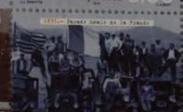
1931 - Parade navale de la France 3,00 Saint-Pierre-et-Miquelon-RF