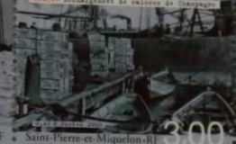
1931 - Débarquement de soldats de Champagne 3,00 Saint-Pierre-et-Miquelon-RF