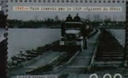
1945 - Train traversé par le 152 e régiment du Génie 3,00 Saint-Pierre-et-Miquelon-RF