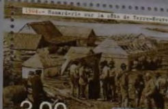
1904 - Embarquement sur la côte de Terre-Neuve 3,00 Saint-Pierre-et-Miquelon-RF

Son engagement dans les combats de 1915, dans ceux des Forces Navales de la France Libre ou de la Libération du territoire, sont aussi des épisodes majeurs qui ont affecté durablement sa population lors des deux guerres mondiales.