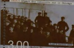
1915 - Départ des conscrits sur le Chicago 3,00 Saint-Pierre-et-Miquelon-RF