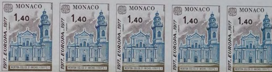
MENTON. EGLISE ST-MICHEL (XVII E S.)