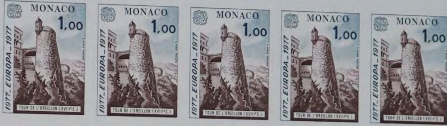
MONACO. TOUR DE L'OREILLON (XVIII E S.)