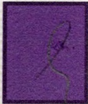
KRINGETJE p.d. 4