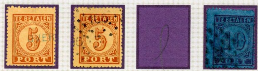
WITTE VLEK ONDER BE