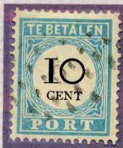
BREUK IN E