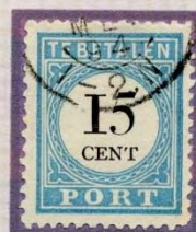
BREUK IN T