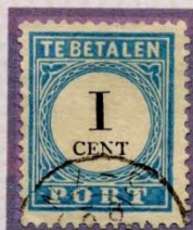
BREUK IN N