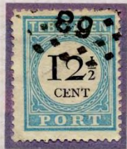
BREUK IN E