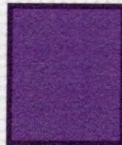
BESCHADIGDE N VAN CENT