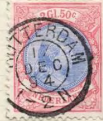
L 11½ x 11