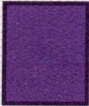
STREEP ONDER EN