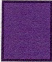
BESCHADIGDE 1 e D