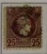
25 Lepta, Farbe: a. purpurviolett