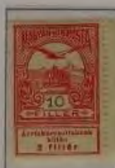
10 Filler karminrot