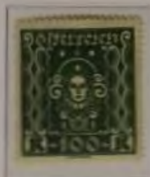
100 Kronen Farbe: a. olivgrün