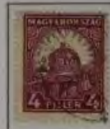
4 Filler rotviolett