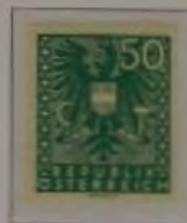
b. dkl. smaragdgrün