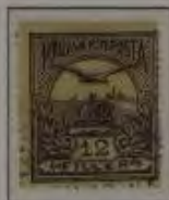
12 Filler rotviolett