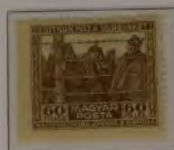
60 Filler dkl. graubraun