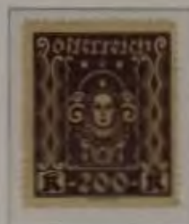
200 Kronen Farbe: a. dkl. violett