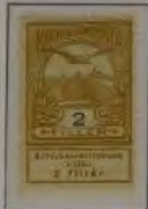
2 Filler dkl. olivgelb