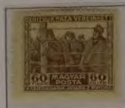
60 Filler hellgraubraun