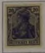
20 Pfg. (violett)ultramarin