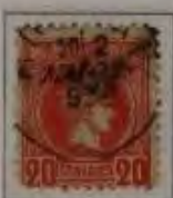
b. dkl. rot