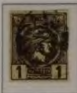
1 Lepta, Farbe: a. dkl. braun