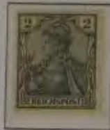
2 Pfg. hellblaugrau