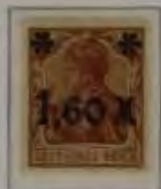
1,60 Mk. auf 5 Pfg. hellbraun