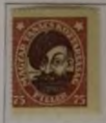
75 Filler dk. rotilla/schwarzbraun