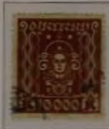
10.000 Kronen Farbe: a. rotbraun