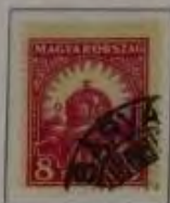
8 Filler dkl. lilart

26. März, 1926/24. Januar 1927 Freimarken Stephanskrone