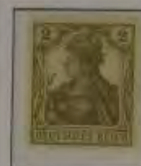
2 Pfg. hellgrau