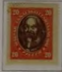
20 Filler dk. rosa/braun

Karl Marx, 1818–1883, Philosoph und Nationalökonom