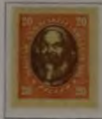
20 Filler gelbrosa/braun