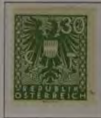
b. dkl. grauliv