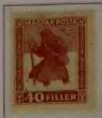
40 Filler dkl. braunrot

10. März 1920, Für die noch nicht heimgekehrten ungarischen Kriegsgefangenen