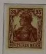
35 Pfg. dkl. rotbraun