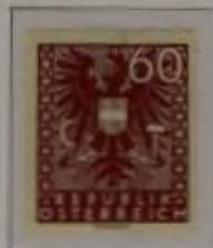
b. dkl. braunrot