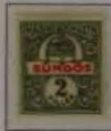
2 Filler oliv/rot