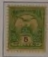
5 Filler gelbgrün