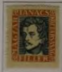
45 Filler gelbbraun/dk. grün