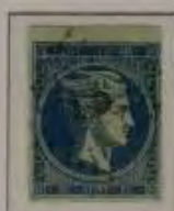
20 Lepta, Farbe: a. dkl. blau