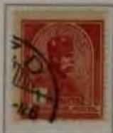
1 Korona braunrot