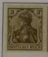
3 Pfg. gelbockerbraun