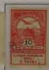
10 Filler hellkarmin