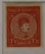
15 Filler dk. rosa