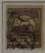
12 Filler dkl. grauviolett