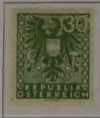
30 (Pf.) Farbe: a. grauliv