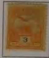
3 Filler grautorange