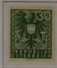
c. dkl. oliv