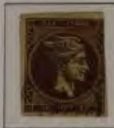
30 Lepta, Farbe: a. dkl. braun