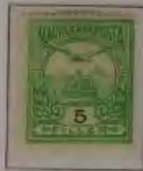
5 Filler hellgrün