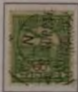
60 Filler dkl. olivgrün