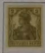
2 Pfg. Dkl. grau