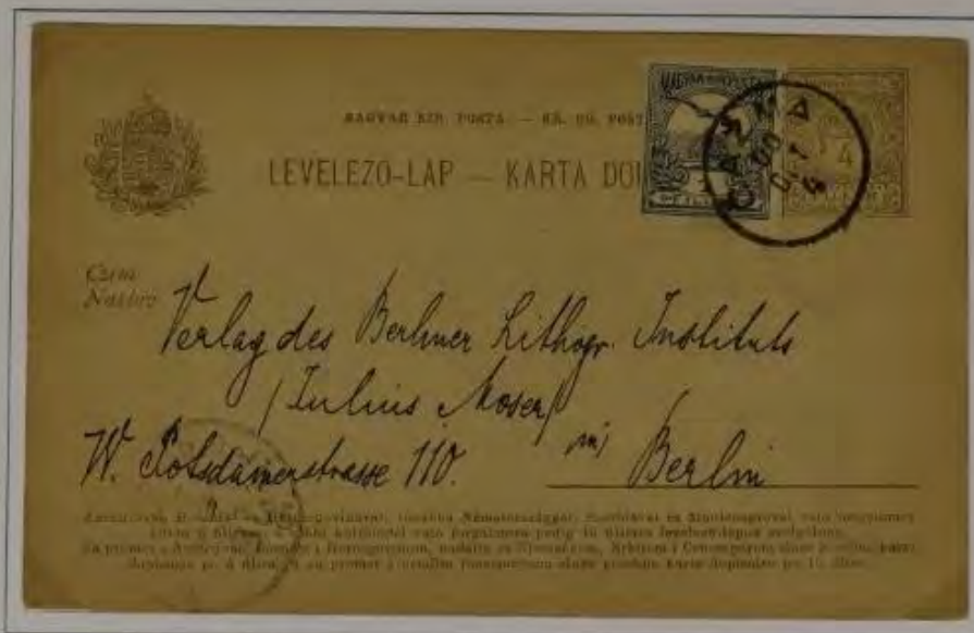
Postkarte von 4 Filler und zusatzfrankatur von 1 Filler Turul schwarzgrau