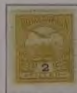
2 Filler hellgelb