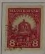
8 Filler lilart