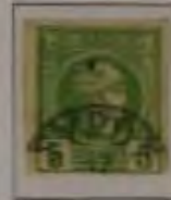
c. mt. graugrün