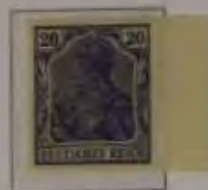
20 Pfg. hellblauviolett