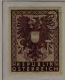
b. dkl. lila