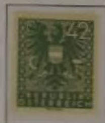
c. dkl. grau