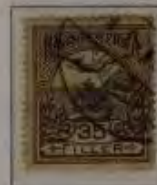
35 Filler gelbflila