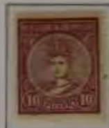
10 Filler grauviolet