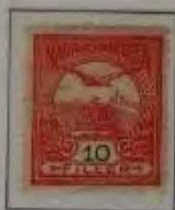
10 Filler dkl. karmirosa