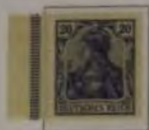
20 Pfg. (grau)ultramarin