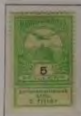
5 Filler dkl. olivgrau