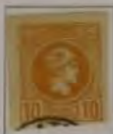
10 Lepta, Farbe: a. gelborange