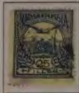
25 Filler dkl. blau