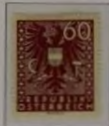
60 (Pf.) Farbe: a. br. karmin