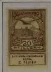
20 Filler hellbraun