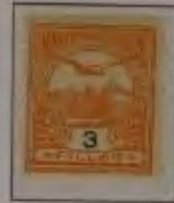
3 Filler orange