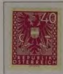
c. dkl. lila