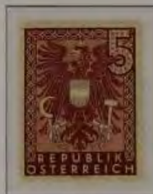
b. rotbr. karmin