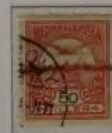
50 Filler hellkarmin