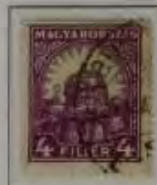
4 Filler dkl. violett