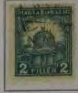
2 Filler dkl. blau