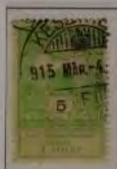
5 Filler hellolivgrau