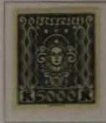
5000 Kronen Farbe: a. dkl. schiefer