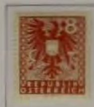
b. dkl. ocker