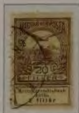
20 Filler dkl. rotbraun