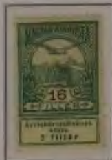
16 Filler graugrün