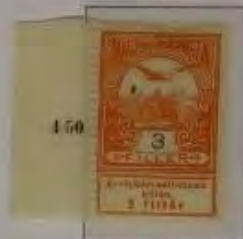
3 Filler dkl. orange