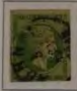
5 Lepta, Farbe: a. dkl. grün