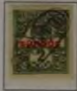
2 Filler dk. oliv/rot