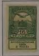
16 Filler hellgraugrün