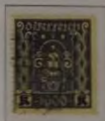
1000 Kronen Farbe: a. violett