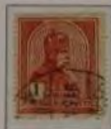
1 Korona karminrot