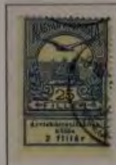
25 Filler ultramarin