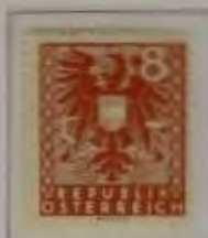
8 (Pf.) Farbe: a. hellocker