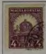
4 Filler grauviolett