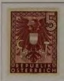
5 (RM) Farbe: a. dkl. br. karmin