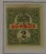
2 Filler helloliv/rot