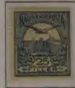
25 Filler graublau