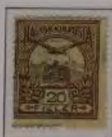
20 Filler braun