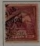
35 Filler rotlila