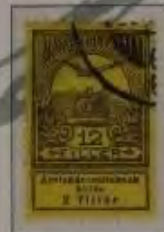
12 Filler grauviolett auf gelb