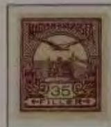
35 Filler dkl. rotlila