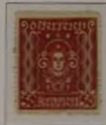
50 Kronen Farbe: a. dkl. rot