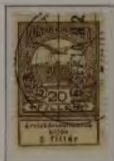
20 Filler braun