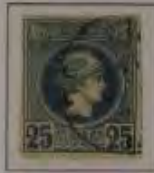
b. dkl. ultramarin