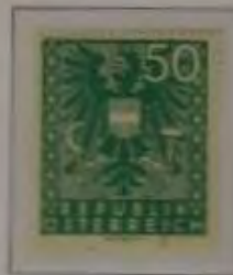
50 (Pf.) Farbe: a. smaragdgrün