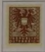
3 (Pf.) Farbe: a. braun

03.07./21.11.1945 „Wappenzeichnung.“ Freimarken-Ausgabe für die russische Besatzungszone