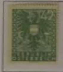
42 (Pf.) Farbe: a. grau