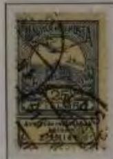
25 Filler hellultramarin