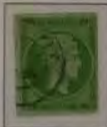
5 Lepta, Farbe: a. grün