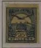
25 Filler ultramarin