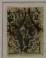
2 Lepta, Farbe: a. dkl. grau