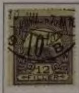
12 Filler dkl. violett