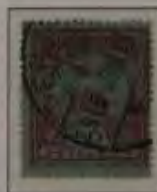
50 Filler graulilaret auf blau