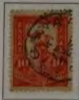
10 Lepta, Farbe: a. dkl. rot