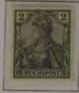
2 Pfg. Dkl. blaugrau