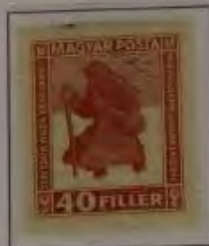
40 Filler braunrot