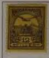
12 Filler violett/schwarz auf gelb