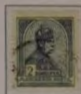
2 Korona hellblau