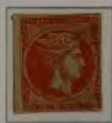
10 Lepta, Farbe: a. dkl. rotbraun