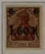
1,60 Mk. auf 5 Pfg. dk. braun