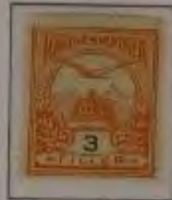
3 Filler dkl. orange