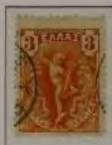
3 Lepta, Farbe: a. dkl. orange