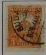
3 Filler hellorange