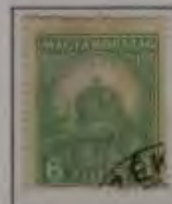
6 Filler mattgrün