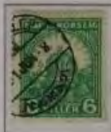
6 Filler dkl. grün