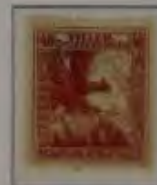
40+2 Filler braunrot