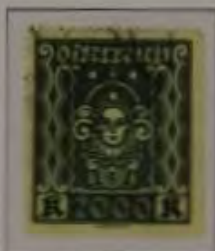
2000 Kronen Farbe: a. dkt. grün