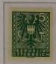
c. dkl. grün