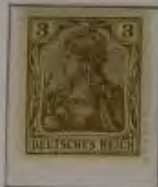
3 Pfg. gelbbraun