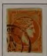
10 Lepta, Farbe: a. dkl. orange