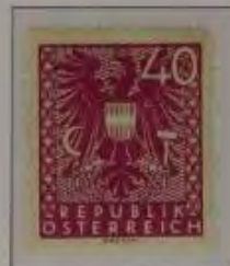
40 (Pf.) Farbe: a. lila