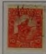
10+2 Filler orangerosa