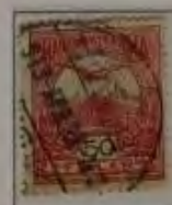
50 Filler karminrot