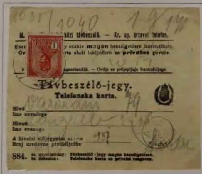
Telefonkarte mit König Franz Josef, 1 Korona braunrot (1830–1916)