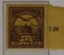
12 Filler rotviolett/schwarz auf gelb