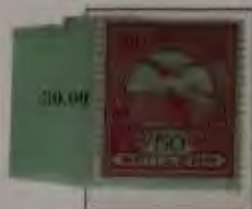
50 Filler dkl. lilaret auf blau