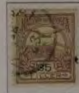
35 Filler hellrotlila