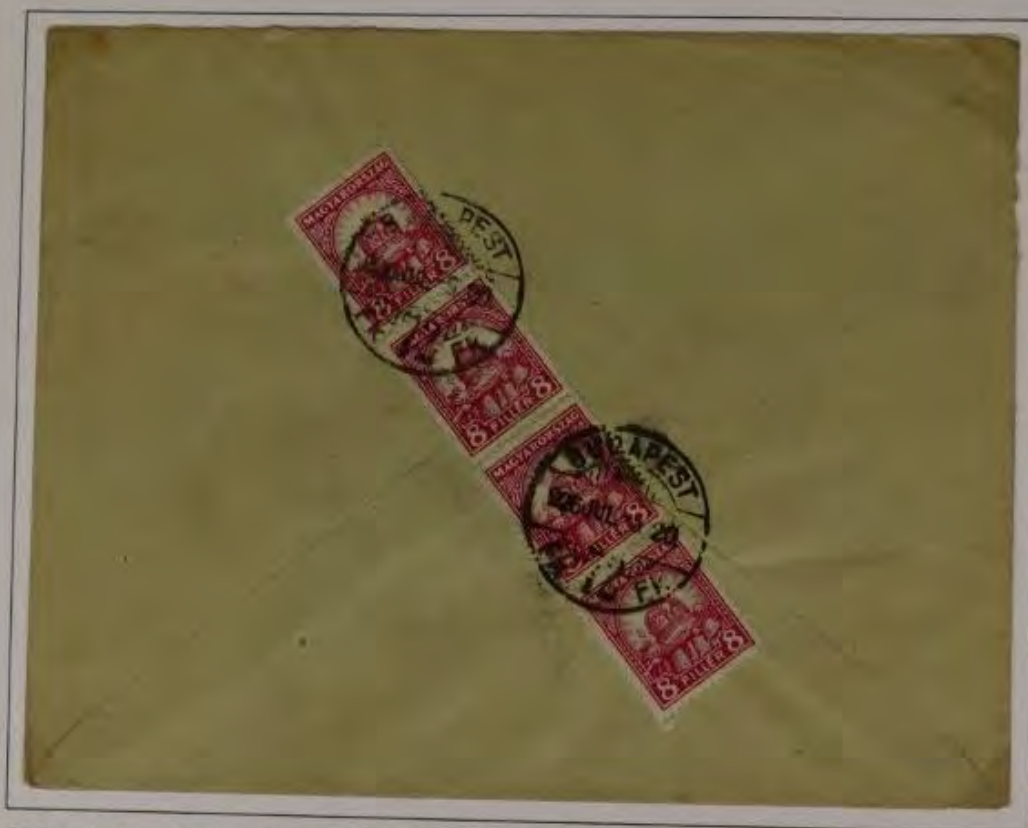
Brief von Budapest (Zweigniederlassung Uhrenfabrik von Herren Aug. Schatz und Söhne in Budapest) nach Triberg. Freigemacht mit 4 x 8 Filler dkl. lilart. Stempel: Budapest 26. Juli 1938