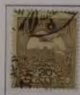
20 Filler hellbraun