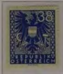
38 (Pf.) Farbe: a. hellblau