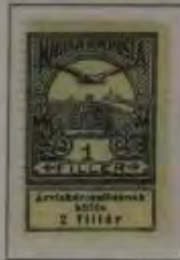
1 Filler grauschwarz

20. November 1913. Hochwasserhilfe für den Ost-Banat