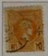
10 Lepta, Farbe: a. orange

Kleiner Hermeskopf im Kreis (gezähnt und geschnitten)