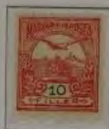
10 Filler hellkarmirosa