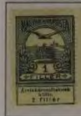
1 Filler grau