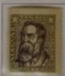
80 Filler helloliv/dk. braun