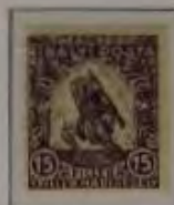
15+2 Filler violett