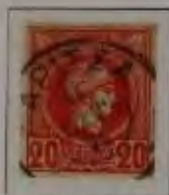
20 Lepta, Farbe: a. dkl. rot