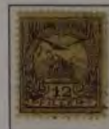
12 Filler braunviolett