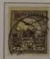
80 Filler helllila