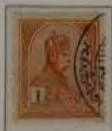
1 Korona orangerot