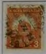
3 Filler dkl. orange