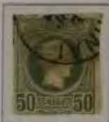
50 Lepta, Farbe: a. dkl. graugrün