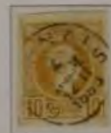
c. bls. gelborange