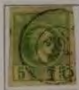
5 Lepta, Farbe: a. grün