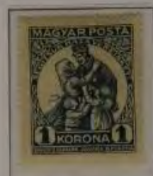
1 Korona dkl. blau