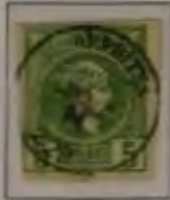
5 Lepta, Farbe: a. dkl. grün