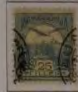
25 Filler hellblau