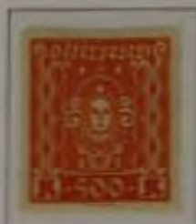
500 Kronen Farbe: a. rotorange