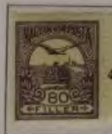
80 Filler dkl. lila/schwarz