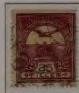
35 Filler mitl. rotlila