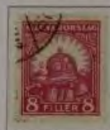
8 Filler hellilart