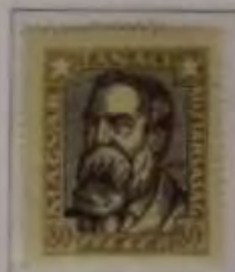
80 Filler dk. oliv/dk. braun

Friedrich Engels, 1820–1895, Publizist, Sozialist