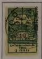
16 Filler dkl. graugrün

20. November 1913. Hochwasserhilfe für den Ost-Banat