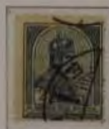
2 Korona graublau