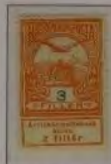
3 Filler hellorange