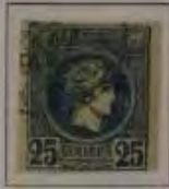
25 Lepta, Farbe: a. ultramarin