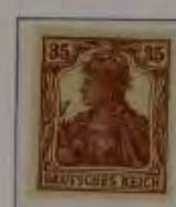
35 Pfg. rotbraun