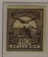
80 Filler rotlila