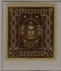
20 Kronen Farbe: a. dkl. braun

1922 / 1924 Freimarken-Ausgabe „Frauenkopf“ (Kunst)