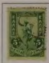
5 Lepta, Farbe: a. dkl. grün