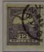
12 Filler hellviolett/schwarz