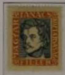
45 Filler hellgelbbraun/hellgrün