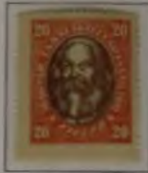
20 Filler hellrosa/braun