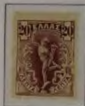
20 Lepta, Farbe: a. dkl. violett