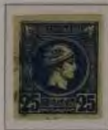
25 Lepta, Farbe: a. schw.ultramarin