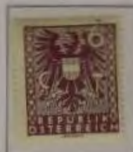
6 (Pf.) Farbe: a. blauviolet