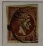
1 Lepta, Farbe: a. dkl. braun