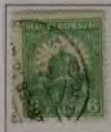
6 Filler gelbgrün