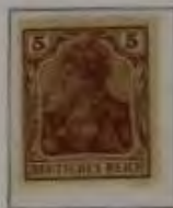
5 Pfg. dk. braun