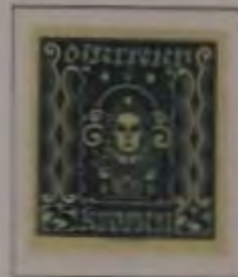
25 Kronen Farbe: a. dkl. blau