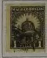
1 Filler hellgrau