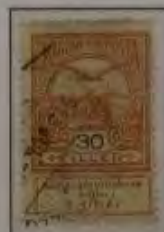
30 Filler hellbraunorange