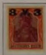
3 Mk. auf 1 1/4 Mk. bräunlich