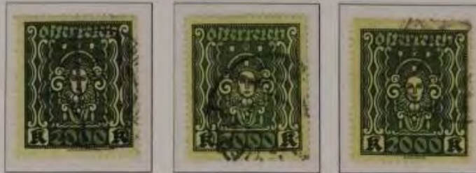
Hier ein Beispiel an Marken aus Österreich 1922 / 1924 Freimarken-Ausgabe „Frauenkopf“ (Kunst)

Vor 50 oder 100 Jahren war die Herstellung von Briefmarken bei weitem noch nicht so perfekt wie heute und durch verschiedene Auflagen entstanden markante Farbunterschiede. In der heutigen Zeit, bei der Computer-gesteuerten Druckmaschinen kommt diese Fehler kaum noch vor.