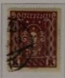
3000 Kronen Farbe: a. dkt. ilabraun