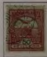
50 Filler helllilaret auf hellblau