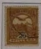
20 Filler rotbraun