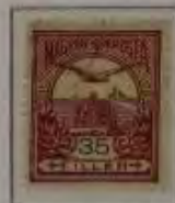
35 Filler grauflila