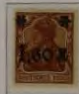
1,60 Mk. auf 5 Pfg. orangebraun