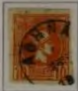
10 Lepta, Farbe: a. dkl. orange