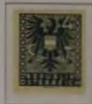
4 (Pf.) Farbe: a. dkl. blaugrau