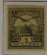
1 Filler schwarzgrau