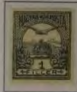
1 Filler grau

Freimarken Ausgabe Turul und König Franz Josef von 1. Januar 1900/1901 Inchrift: MAGYAR KIR POSTA Wertziffer schwarz. Der mythische Vogel Turul überfliegt die Stephanskrone.