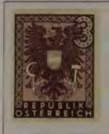
3 (RM) Farbe: a. schwarzlila