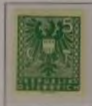
5 (Pf.) Farbe: a. grün