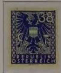
b. dkl. ultramarin