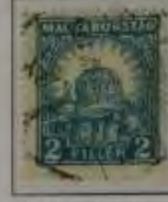
2 Filler hellblau