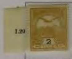
2 Filler olivegelb