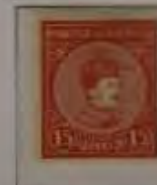
15 Filler hellrosa