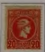
20 Lepta, Farbe: a. weinrot