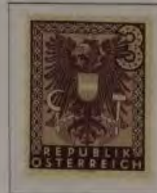
c. hell lila