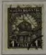
1 Filler dkl. grau

26. März. 1926/24. Januar 1927 Freimarken Stephanskrone