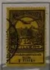
12 Filler dkl. violett auf gelb