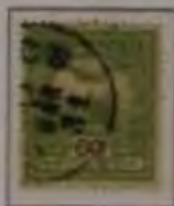
60 Filler grauolivgrün