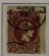
25 Lepta, Farbe: a. dkl. violett