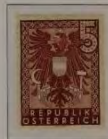
c. hell br. karmin