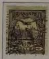
80 Filler graulila