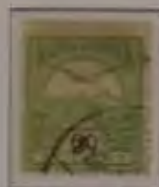
60 Filler hellolivgrün