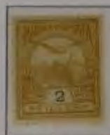
2 Filler gelb