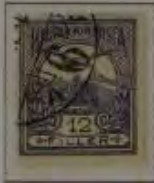
12 Filler violett/schwarz