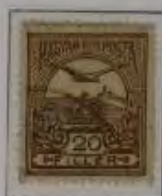
20 Filler dkl. braun