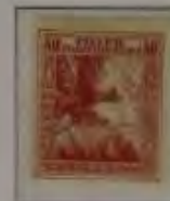
40+2 Filler hellbraunrot