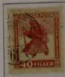
40 Filler mattbraun