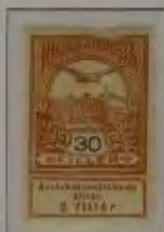
30 Filler braunorange