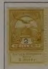
2 Filler hellolivgelb