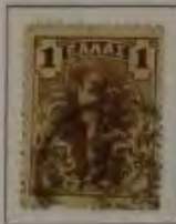
1 Lepta, Farbe: a. dkl. braun