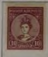
10 Filler dk. violet