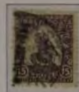
15+2 Filler grauviolett