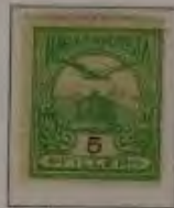
5 Filler graugrün