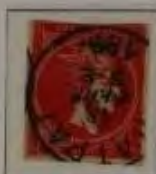
20 Lepta, Farbe: a. weinrot