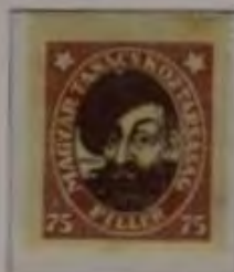
75 Filler hellrotilla/schwarzbraun

Friedrich Engels, 1820–1895, Publizist, Sozialist