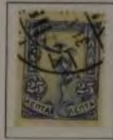
25 Lepta, Farbe: a. dk. ultramarin