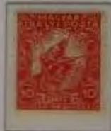
10+2 Filler rosa