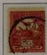
50 Filler dkl. karmin