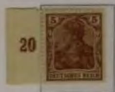
5 Pfg. hellbraun