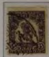
15+2 Filler dk. violett