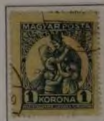
1 Korona mattblau