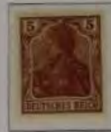
5 Pfg. orangebraun