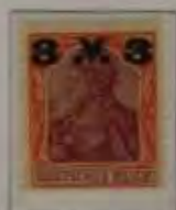
3 Mk. auf 1 1/4 Mk. bräunl. rotbraun