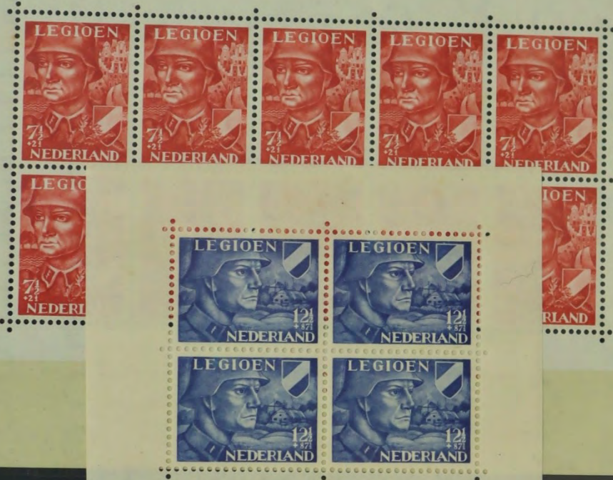
ZEGEL, UITGEGEVEN TEN BATE VAN HET VOORZIENINGSFONDS VAN HET NEDERLANDSCH LEGIOEN, 1942.