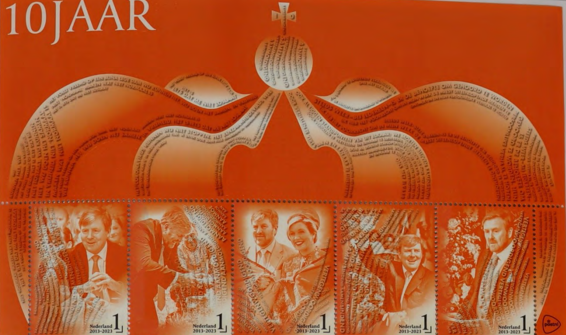
Zevende editie van de Koningspelen, Lenzmer