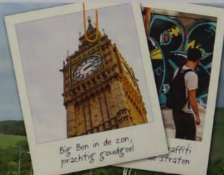
Big Ben in de zon, prachtig goudgeel

Reizen met de Eurostar is relaxed. En het gaat supersnel. We zijn al bijna in Londen. Het landschap zoemt in zo'n hogesnelheidslijn zo aan je voorbij dat ik er eerlijk gezegd niet van van mee heb gekregen.