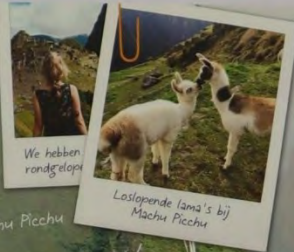
We hebben rondgelopen

Het was maar een rit van nog geen vier uur, maar wat een spektakel. Je rijdt dwars door de Andes en de pieken worden hoe dichtter je Machu Picchu nadert steeds groener, steiler en hoger. Durzelingswekkend, want de hoogtes hier zijn nog niet helemaal gewend aan de hoogtes hier.