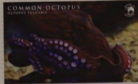
COMMON OCTOPUS MOÇAMBIQUE 16.00 MT