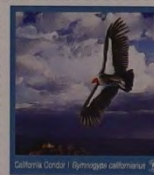
CANOUAN $3 GRENADINES OF ST. VINCENT