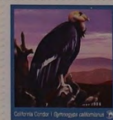
CANOUAN $3 GRENADINES OF ST. VINCENT

Damagazelle ( Nanger dama ), Niger. Deze grootste soort gazelle wordt ernstig bedreigd en is bijna uitgestorven. Door ongecontroleerde jacht en habitatverlies in de laatste 10 jaar is maar liefst 80% van de populatie verdwenen. In totaal zijn er nog minder dan 500 exemplaren in het wild over. De IUCN-status is in enkele jaren bijgesteld van 'kwetsbaar' naar 'ernstig bedreigd (kritiek)'.