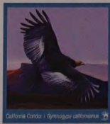
CANOUAN $3 GRENADINES OF ST. VINCENT

Californische condor ( Gymnogyps californianus ), Canouan. Deze roofvogel maakt deel uit van de gierenfamilie Cathartidae en is een uitstekend zweefvlieger. Hij kwam ooit voor in grote delen van Noord-Amerika. Tegenwoordig is hij in het wild praktisch uitgestorven en heeft hij de status 'kri-tiek' op de IUCN-Rode lijst. De primaire oorzaken hiervan zijn de jacht en vergiftiging door de mens.