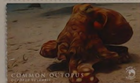
COMMON OCTOPUS MOÇAMBIQUE 16.00 MT

Californische condor ( Gymnogyps californianus ), Canouan. Deze roofvogel maakt deel uit van de gierenfamilie Cathartidae en is een uitstekend zweefvlieger. Hij kwam ooit voor in grote delen van Noord-Amerika. Tegenwoordig is hij in het wild praktisch uitgestorven en heeft hij de status 'kri-tiek' op de IUCN-Rode lijst. De primaire oorzaken hiervan zijn de jacht en vergiftiging door de mens.