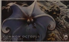
COMMON OCTOPUS MOÇAMBIQUE 16.00 MT

Gewone octopus ( Octopus vulgaris ), Mozambique. Deze inktvis (zijn naam betekent 'achtarm') komt in diverse zeeën voor en leeft vooral 's nachts. Talloze dieren hebben deze octopus als prooi, waaronder zeebaarzen en murenen. In de Aziatische en Mediterrane keukens is het dier daarbij bijzonder geliefd. Ze worden daarom veel gevangen door vissers in deze gebieden.