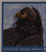
CANOUAN $3 GRENADINES OF ST. VINCENT