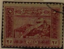
SCHLOSS AM SEYHAN-FLUSS