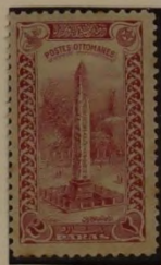
OBELISK DES THEODOSIUS IM HIPPODROM