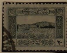
HAFEN V. SMYRNA

SONDERAUSGABE: "NATIONALE EINIGUNG" 1922