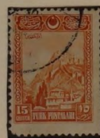
ANSICHT DER FESTUNG - ANKARA -