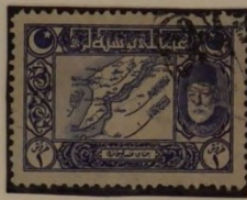
KARTE DER DARDANELLEN