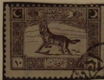
DER GRAUE WOLF