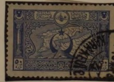
LANDKARTE VON GALLIÖDLIS