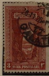
ENGPAß VON SAKARIA UND SCHLACHTFELD VON INÖNI