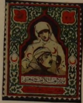
KRANKENPFL. U. VERWUNDETER