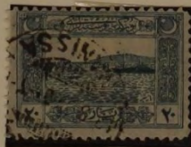
HAFEN VON SMYRNA