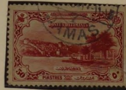
BOSPORUS BEI RUMELI - HISSAR