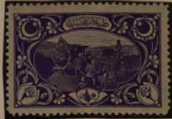
ARTILLERIE IN FEUERSTELLUNG