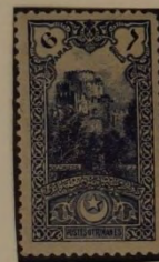
SCHLOSS DER SIEBEN TÜRME