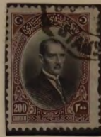
MUSTAFA KEMAL PASCHA