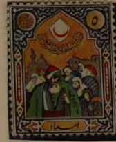
GRUPPE VON FLÜCHTLINGEN