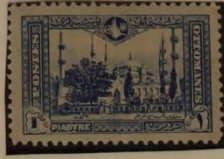
MOSCHEE DES SULTAN AHMED