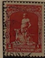
DER SCHMIED MIT DEM GRAVEN WOLF BOZKUR