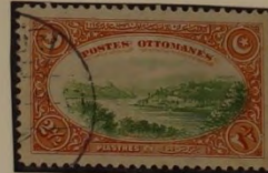
ANSICHT DES BOSPORUS