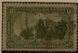
SOLIMAN - MOSCHEE