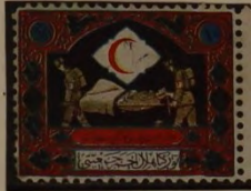
KRANKENTRANSPORT TRÄGER u. BAHRE

ZUSCHLAGSMARKEN - AUSHILFS-AUSGABE MIT AUFDRUCK 1927