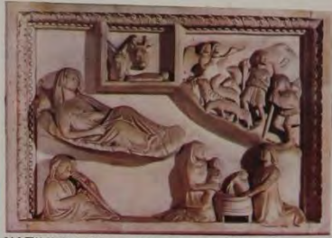
NATIVITA' (Giovanni da Campione d'Italia)