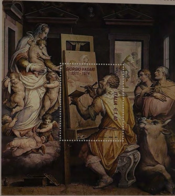
S. LUCA DIPINGE LA VERGINE