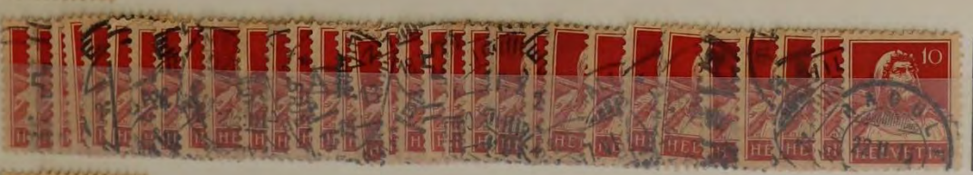
Mi. 118 W. Tell 1914 Tpe 2 1,00 dm 1,50 dm