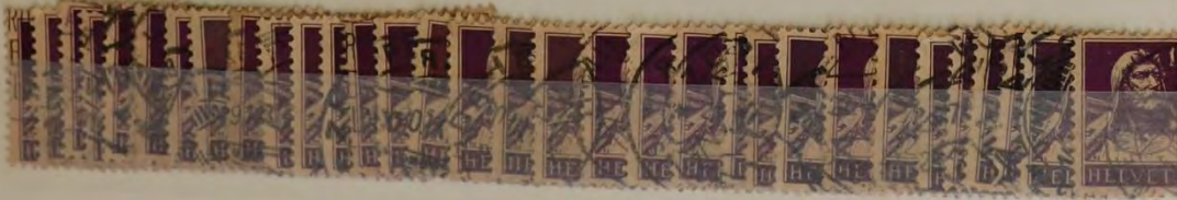
Mi. 120 W. Tell 1914 b 5,00 dm 1,50 dm