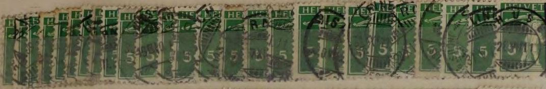
Mi. 113 tellknaap 1910 Type 2 0,50 dm 15,00 dm