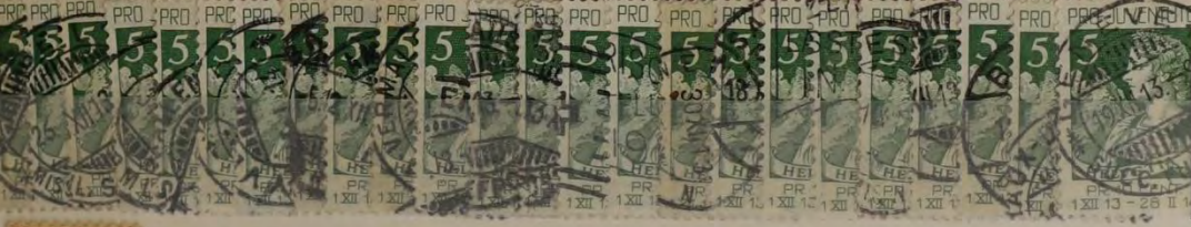
Mi. 117 1913 6,00 dm 20,00 dm