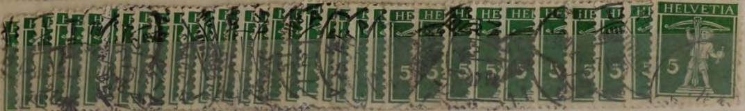
Mi. 113 tellknaap 1911 Type 3 2,00 dm 1,00 dm