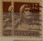
Mi. 119 W. Tell 1914 0,80 dm 12,00 dm