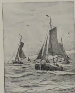
H. W. MESDAG.

JUBILEUMJAAR 1898. VEREENIGING MOED, BELEID EN TROUW. UITGEGEVEN TER GELEGENHEID VAN DE INHULDIGING VAN KONINGIN WILHELMINA I.