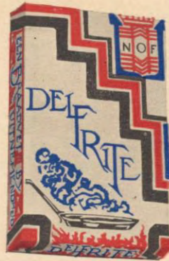
DELFRITE, het nieuwe Plantenvet van de OLIEFABRIEKEN CALVÉ-DELFT

Wie T.I.B.O. steunt, helpt „STILLE ARMEN” Secr.: E. Baron v. Voorst tot Voorst, Daendelsstr. 16, Den Haag