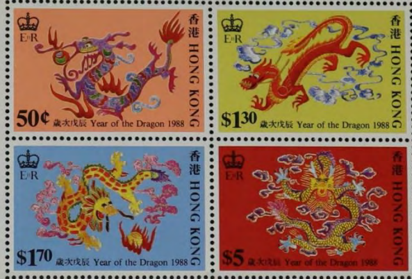
The Year of the Dragon 新球強設計 Designed by Kan Tai-keung