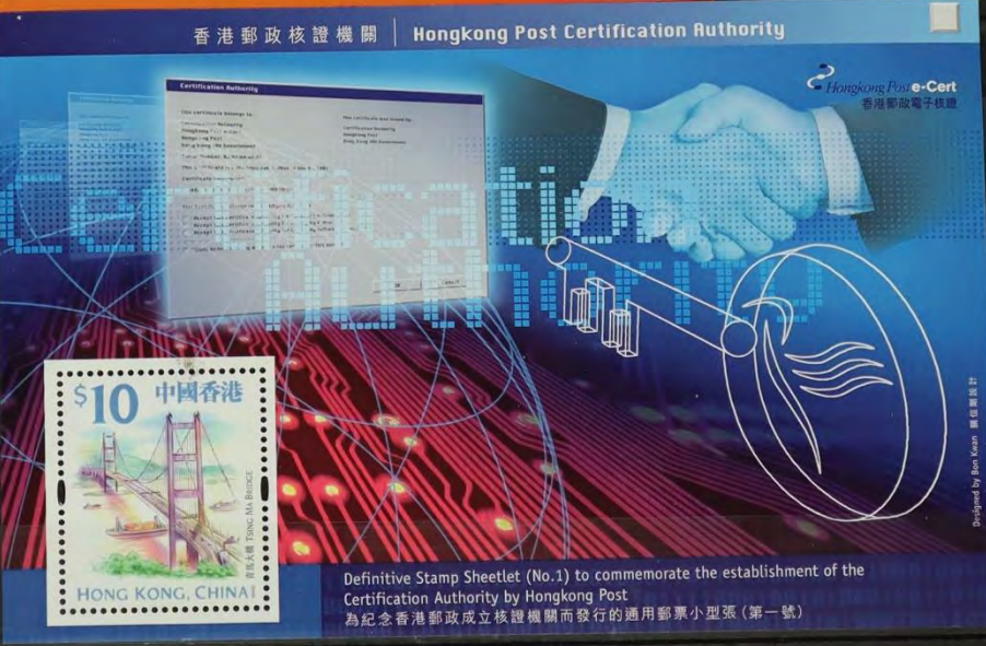
Definitive Stamp Sheetlet (No.1) to commemorate the establishment of the Certification Authority by Hongkong Post 為紀念香港郵政成立核證機關而發行的通用郵票小型張(第一號)