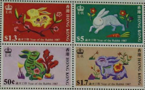
The Year of the Rabbit 新球強設計 Designed by Kan Tai-keung