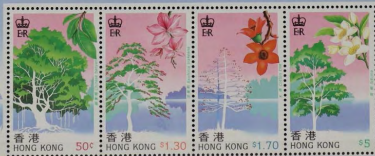
Designed by Anthony Yuk Tong Chan 陳玉棠設計