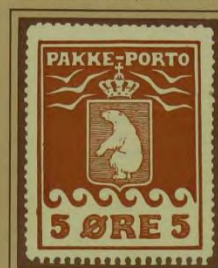
1918, Andet Tryk officielt optakket 11 1/2. Farveplet i venstre ramme, position 21 i arket.