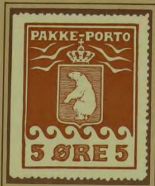
1910, Andet Tryk, »kantmærke«. Brun krølle på venstre bølge, position 6 i arket.