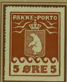
1910, Andet Tryk »hjørnemærke«. Skår i højre ramme, position 25 i arket.