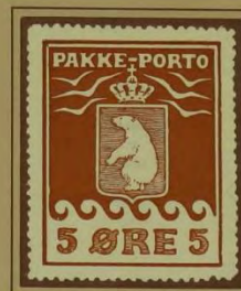
1910, Andet Tryk, »midtermærke«, samme kliché nu som position 7 i arket.