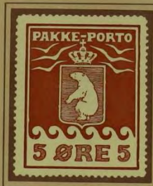
1905, Første Tryk. Skår i højre ramme, position 4 i arket.