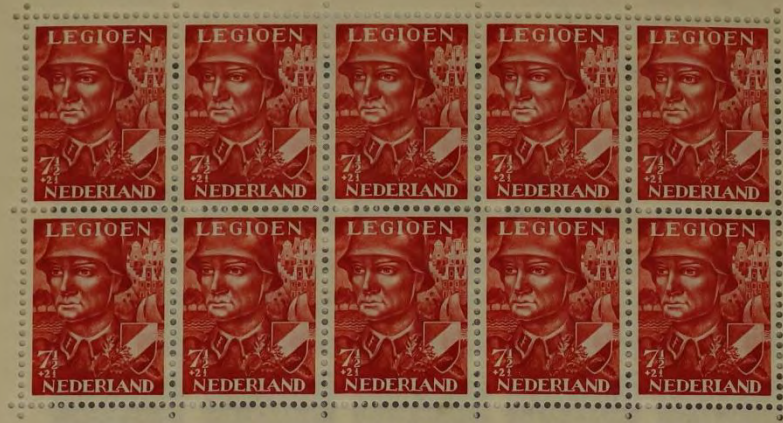
ZEGEL, UITGEGEVEN TEN BATE VAN HET VOORZIENINGSFONDS VAN HET NEDERLANDSCH LEGIOEN, 1942.