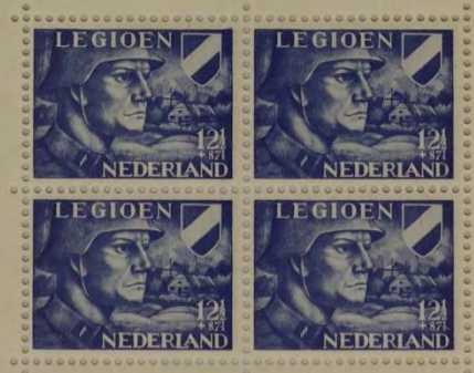
ZEGEL, UITGEGEVEN TEN BATE VAN HET VOORZIENINGSFONDS VAN HET NEDERLANDSCH LEGIOEN, 1942.