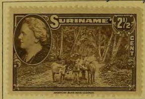
Weg in Coronie