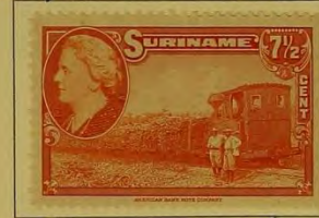
Vervoer van suikerriet.