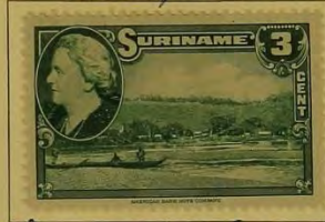
Suriname rivier bij Berg en Dal