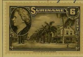
Straat in Paramaribo