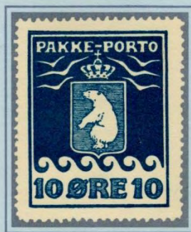
1924. Andet oplag, ialt 17.500 stk. Mørkeblå, næsten sortblå, på tyndere, gennemskinneligt, gråligt papir. Mærkeformatet er normalt temmelig stort, med uregelmæssig takning, og mærkerne har en tendens til at «rulle» fra side til side.