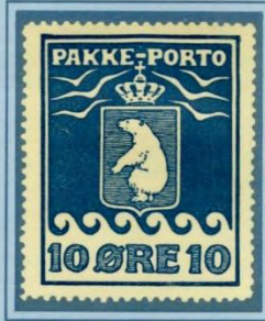
1905, Første Tryk, dråbe på første bolge, position 21 i arket.