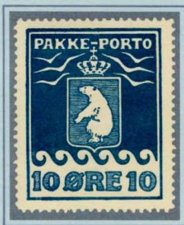
1918. Første oplag, ialt 10.000 stk. Mørkeblå på kraftigt, men forholdsvis porøst, let tonet papir med gullig gummi, der ofte krakkelerer.

10 øre Pakke-Porto mærke takket 11½ udkom i 58.125 eksemplarer, fordelt på 4 oplag. De enkelte oplag har visse kendetegn, der gør det muligt – omend med lidt besvær – at skelne oplagene fra hinanden. Ingen af mærkerne har været udgivet med utakket yderrand, og optakninger forekommer derfor ikke.