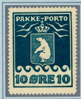
1931. Fjerde oplag, ialt 15.000 stk. Lyserø grønblå (ikke kornet farve), på knap så gennemsigtigt papir, regelmæssig takning.