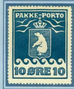
1910, Andet Tryk, -midtermærke-, samme kliché nu som position 17 i arket.