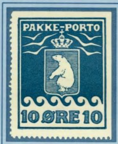
1910, Andet Tryk, -hjørnemærke-, farveplet på venstre ramme, position 5 i arket.