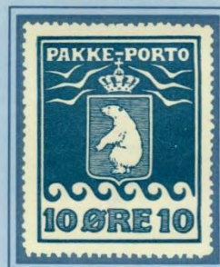
1918, Andet Tryk officielt optakket 11½. Dråbe på første bolge, højre ramme bulet, position 24 i arket.