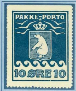
1910, Andet Tryk, -kantmærke-. Skår i nederste rammelinie, position 4 i arket.