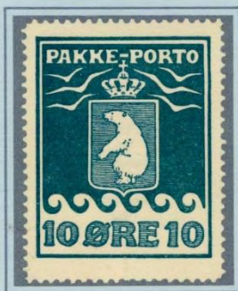
1928. Tredie oplag, ialt 15.625 stk. Kornet, grønblå på tyndt, gennemsigtigt papir, regelmæssig takning.