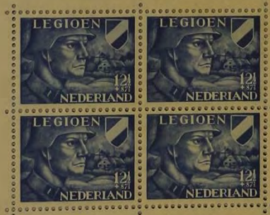
ZEGEL, UITGEGEVEN TEN BATE VAN HET VOORZIENINGSFONDS VAN HET NEDERLANDSCH LEGIOEN, 1942.