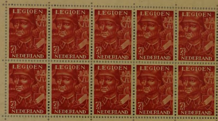
ZEGEL, UITGEGEVEN TEN BATE VAN HET VOORZIENINGSFONDS VAN HET NEDERLANDSCH LEGIOEN, 1942.