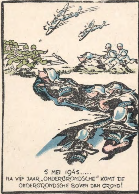
5 MEI 1945..... NA VIJF JAAR „ONDERGRONDSCHER“ KOMT DE ONDERGRONDSCHER BOVEN DEN GROND!