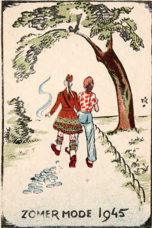
ZOMER MODE 1945