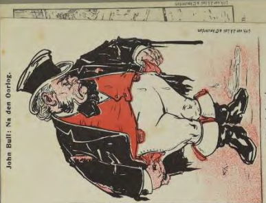
John Bull: Na den oorlog.