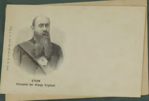
STEIN President der Oranje Vrijstaat.