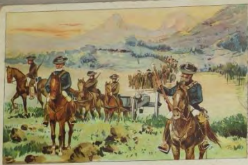
Uebergang über den Tugela Passage de la Tugela