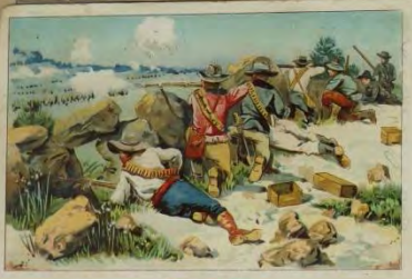
Buren in Feuer. Les Boers en guerre.