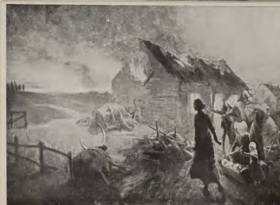
Fournier Safovére. Verbrande boerenboere in Zuid-Afrika. Paris.