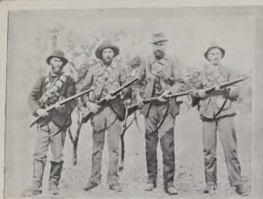
Een groep Transvaalseke Boeren.