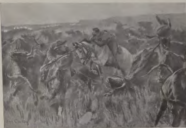
Doorbraak van De Wet door de blokkade van de Zee.