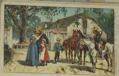
L'Adieu d'un boucher.