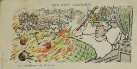
La cauchemar de Victoria.