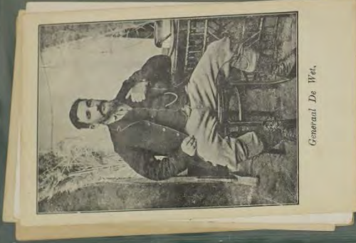
Generaal De Wet.