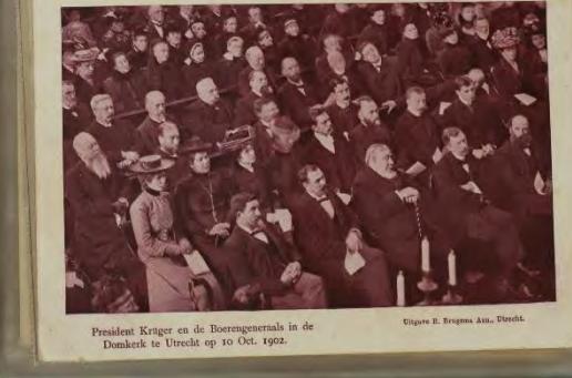
President Kruger en de Boerengeneraals in de Domkerk te Utrecht op 10 Oct. 1902. Vigore E. Hogen als. Utrecht.