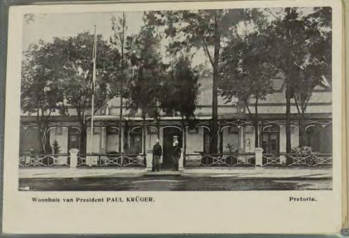
Woonhuis van President PAUL KRÜGER. Pretoria.