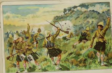
Des Engländer bei Magerfontein Les Anglais à Magerfontein