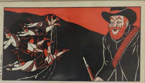
Goed uit Magerfontein Het is opgeleed, overwin als van de keir in de keurplomb, die zoo was en tegen beweging van de Boeren lachje.