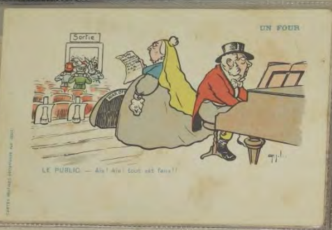
LE PUBLIC - Ah! Ah! tout est faux!