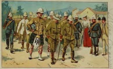
Transport Gefangener Englands. Transport d'Anglais prisonniers.