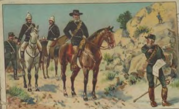
General Joubert mit seinem Stabe l'Etat-major du général Joubert