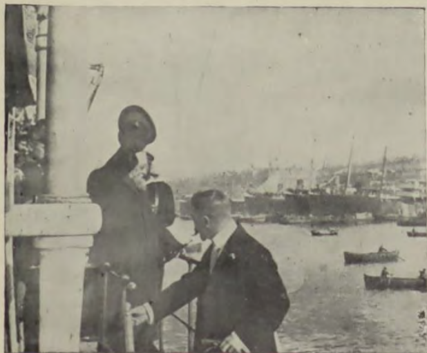
PRESIDENT KRUGER TE MARSEILLE.

Pretoria mit Oranjer. Pretoria en de Or.