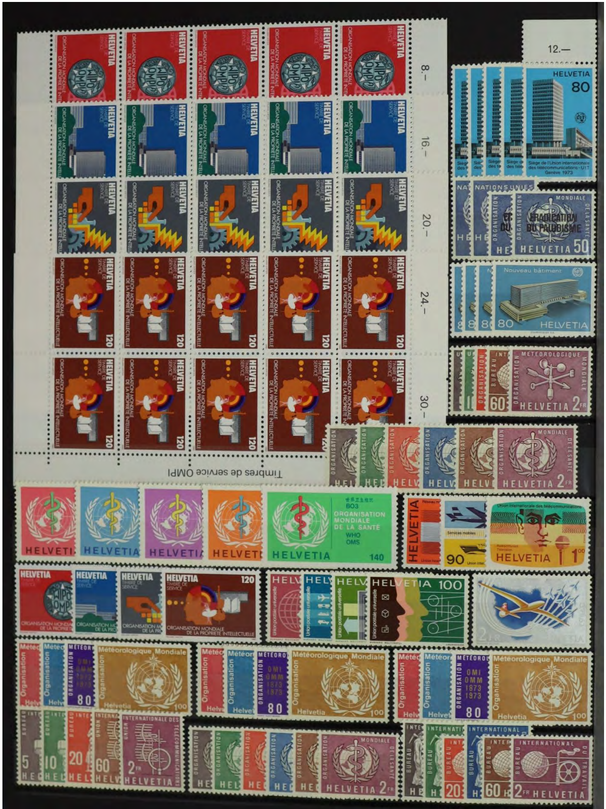
Timbres de service OMI